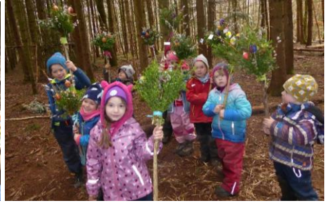
Die Palmbüschen sind fertig.