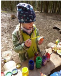
Mit viel Freude werden die Eier bunt bemalt.